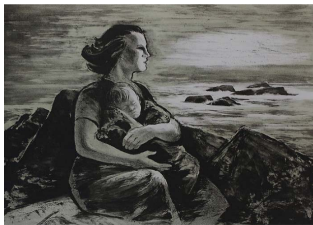
Mor og barn (2005). Bakke hadde alltid mødrene i tankene – de som tok ansvar for hjemmet når mannen var på havet. I 1848 omkom 500 fiskere på Vestfjorden i løpet av en natt.