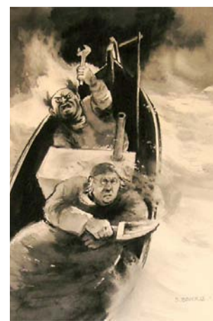
Visitat. Tegning til Kjell Storviks bok Spøkeri i nord (1990).