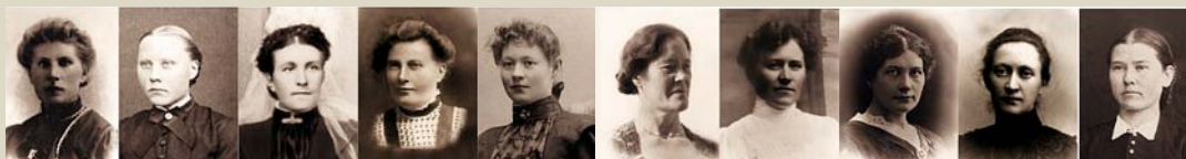
Kvinnene som kjempet fram blant annet stemmeretten.